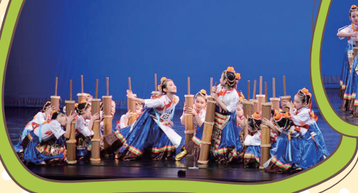
低年級組——《酥油飄香》