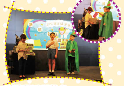
匯豐少年警訊獎勵計劃