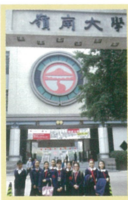
同學在參觀前先拍攝大合照留念

本校德公組於上年度的9月初，成功推薦10名五至六年級的同學，參與由屯門區青年委員會舉辦之「成功有約」屯門區小學生獎勵計畫。