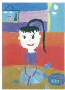
2E 方靖瞳 水滴與我