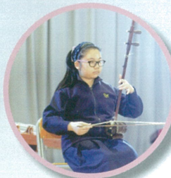
參加獨奏的同學都用心演奏自己的參賽樂曲。