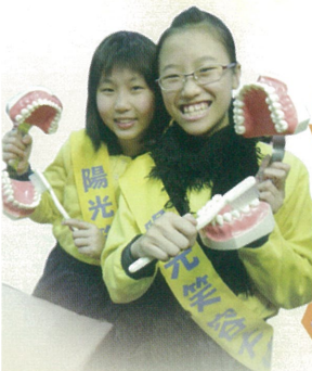
同學們正用心地學習正確刷牙的方法