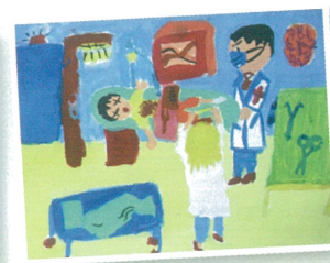
4C 黃樂洵 為我們服務的人