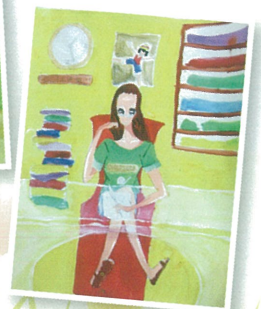
6B 陳欣怡 未來的我