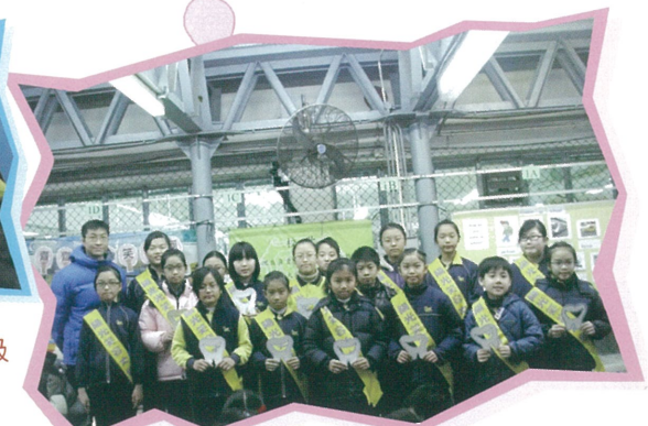
同學們獲委任為本校的陽光笑容大使