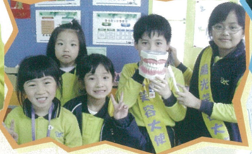
有了健康潔白的牙齒，大家都可以展露陽光般的笑容