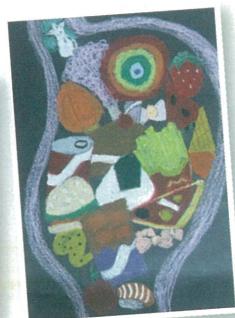
3A 謝詠琪 透視大霸王