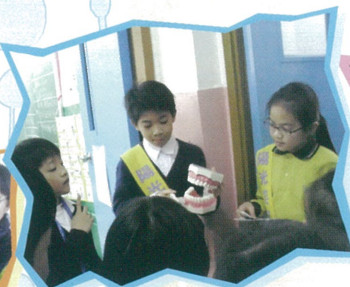
陽光笑容大使指導一年級同學正確刷牙的方法