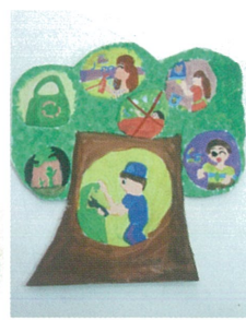
5A 麥可兒 綠色生活